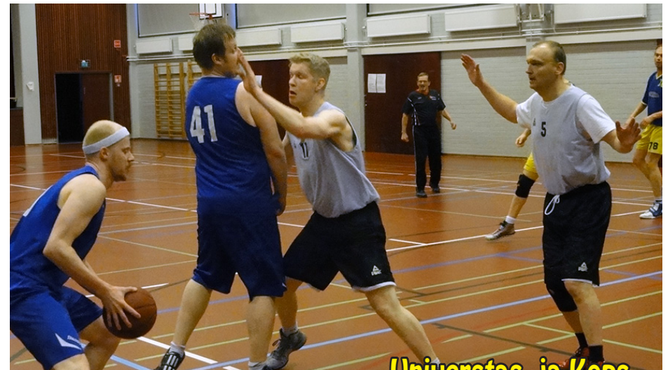
Universtas ja Kops