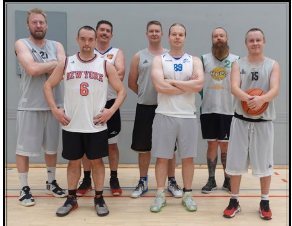
KOPS = Koripalloseura